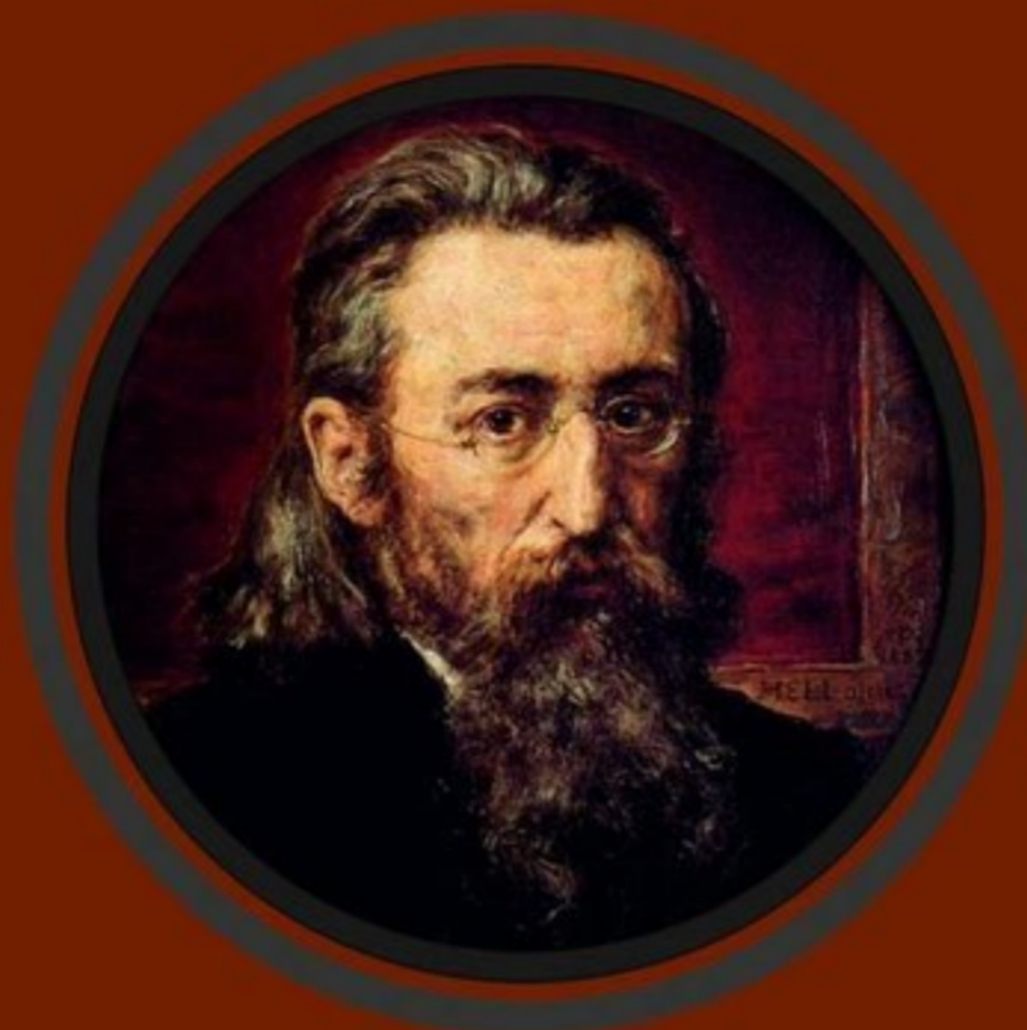
JAN ALOJZY MATEJKO 24.06.1838 - 01.11.1893

Ministerul Culturii al Republicii Moldova, Ambasada Republicii Polone în Chișinău, Zen Club Moldova, Sala cu Orgă, Agenția Relații Interetnice, Academia de Muzică, Teatru și Arte Plastice, Colegiul de Arte Plastice "Alexandru Plămădeală"